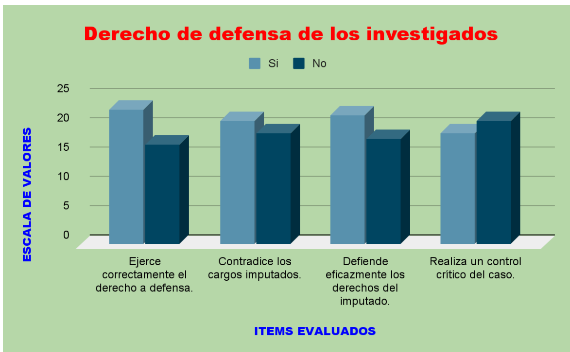
Figura 04: Derecho de defensa de los investigados.