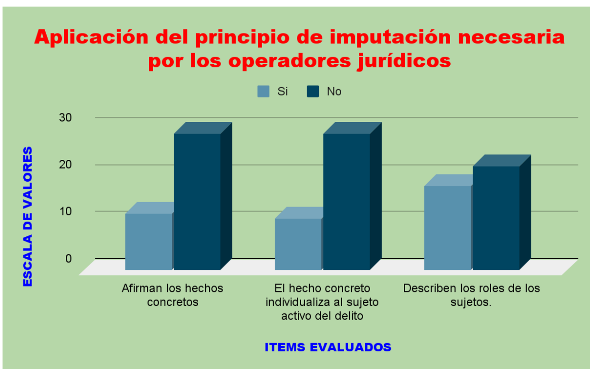
Figura 01: Aplicación del principio de imputación necesaria por los operadores jurídicos.